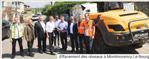
Effacement des réseaux à Montmorency Le Bourg

2,8 M€ POUR LA RÉNOVATION ET LES CRÉATIONS DE VOIRIE